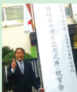
一昨年、母校・本町小の50周年式典にて。今年は母校・小金井一中の70周年です。

◎1966年、岩手県水沢生まれ。秋田県横手市・宮城県仙台市・山形県山形市を経て、1975年、父の転勤で小金井市貫井北町に転入(現在は中町在住)。小金井市立本町小学校・小金井市立小金井第一中学校、東京都立小金井北高等学校、中央大学法学部卒業。株式会社河