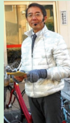
毎朝、駅頭でNEWSの配布。

◎1966年、岩手県水沢生まれ。秋田県横手市・宮城県仙台市・山形県山形市を経て、1975年、父の転勤で小金井市貫井北町に転入(現在は中町在住)。小金井市立本町小学校・小金井市立小金井第一中学校、東京都立小金井北高等学校、中央大学法学部卒業。株式会社河