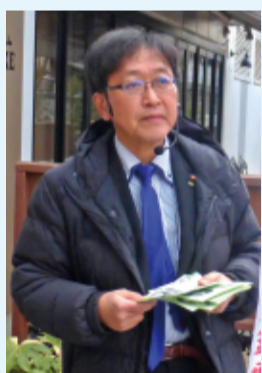
毎朝、駅頭でNEWSの配布。

◎1961年埼玉県川口市生まれ。1985年芝浦工業大学工学部建築工学科卒業。大学卒業後は建築士事務所にて建築・都市計画に携わる。◎1985年小金井市に転入、梶野町や東町にて一児の父として子育てを経験。2009年に小金井市新焼却施設建設場所選定等市民検討委員会に参加し小金井市の行政課題を知り、その後、小金井市新庁舎建設基本構想、基本計画市民検