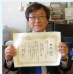
マニフェスト大賞受賞。

クリーン野川作戦にて。討委員会に参加し、新庁舎建設のための提案を行いました。会社勤務の傍ら環境団体や子育て支援団体などに参加し、子どもたちの環境を守るために活動を続けています。野川、くじら山周辺の環境をこよなく愛し、「クリーン野川作戦」では毎年実行委員を務めています。◎市議会では、2015年4月から一期目ながら建設環境委員会の副委員長に就任、自らの経験をふまえたまちづくりの提案を行っています。市内で稲や麦を育て、子どもたちへの環境啓発活動を実践するとともに、地域の活性化の仕組みづくりを模索